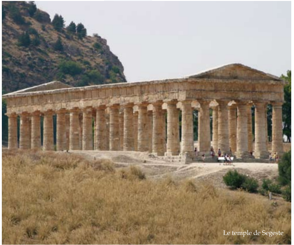
Le temple de Segeste