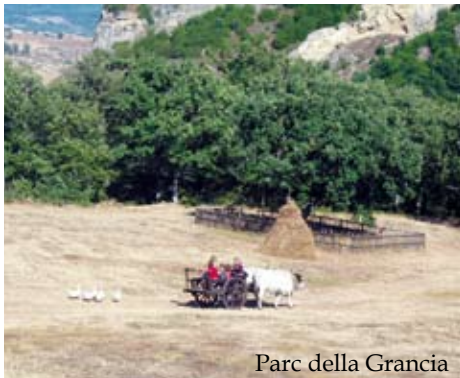
Parc della Grancia