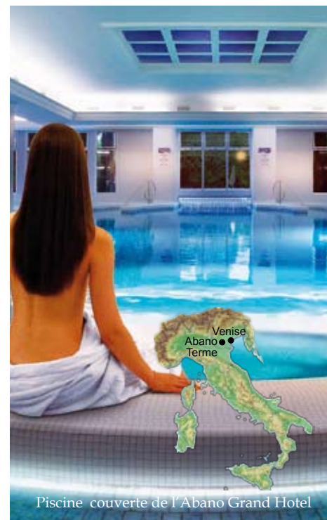
Piscine couverte de l'Abano Grand Hotel

S ituée aux pieds du Parc des Collines Euganéennes, Abano est connue depuis l'Antiquité Romaine pour les vertus de ses eaux et de ses boues en faisant l'un des plus anciens centres thermal d'Europe. L'eau thermale d'Abano provient des Alpes et parcourt environ 80km à plus de 2000mètres de profondeur s'enrichissant en sels minéraux pour jaillir à 85° dans les thermes Euganéens, d'où, associée à l'argile et purifiée, né un «fango» unique aux propriétés thérapeutiques exceptionnelles. La situation permet d'associer l'efficacité des cures thermales au divertissement, une détente raffinée et des loisirs très agréables : tennis, natation, minigolf, boules, golf, jogging, promenades à pied, à bicyclette, excursions... En effet, sa position, à 10km de Padoue, 40km de Vicenza, 50km de Venise et 80km de Vérone, en fait également un lieu idéal pour découvrir cette région.