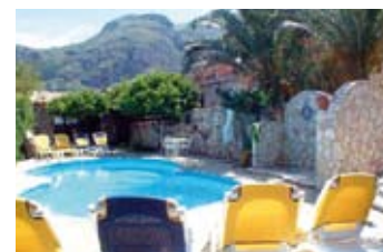
Prix par logement et par semaine (samedi/samedi)