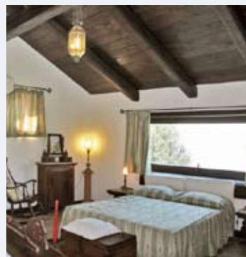
Prix en Euros par logement et par semaine TERRAZZINA