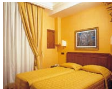
Prix en Euros par logement et par nuit