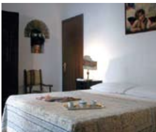
Prix en Euros par logement et par nuit (3 nuits minimum)