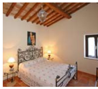
Prix en Euros par logement et par semaine