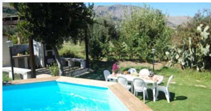
Prix par logement et par semaine (samedi/samedi)