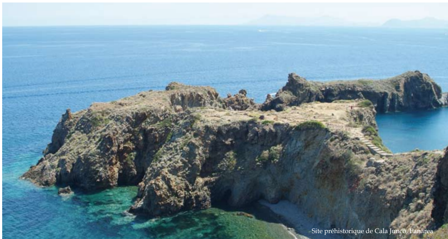
Site préhistorique de Cala Junco, Panarea