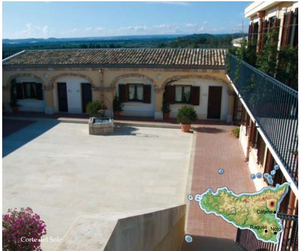
Corte del Sole