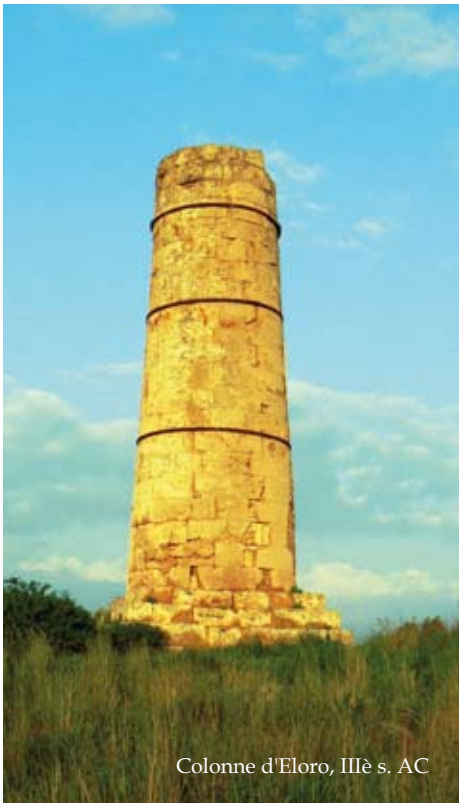
Colonne d'Eloro, III e s. AC