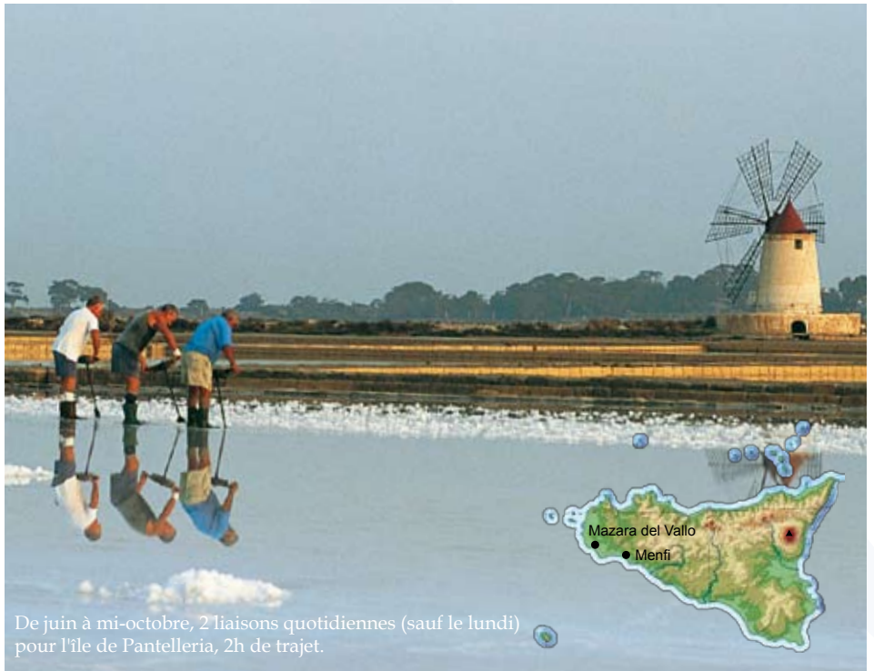
De juin à mi-octobre, 2 liaisons quotidiennes (sauf le lundi) pour l'île de Pantelleria, 2h de trajet.

À l'origine ancien domaine viticole restauré appartenant à la famille anglaise Hopps, son architecture extérieure, quelque peu orientale, suppose les mouvances historiques et favorise le dépaysement.