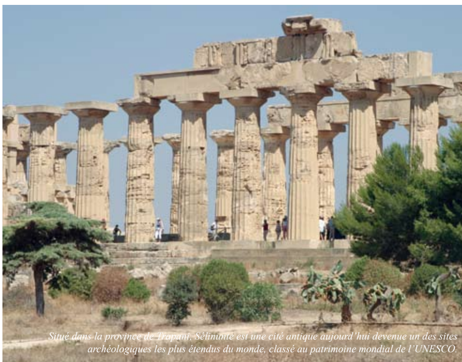
Situé dans la province de Trapani, Selinunte est une cité antique aujourd'hui devenue un des sites archéologiques les plus étendus du monde, classé au patrimoine mondial de l'UNESCO.